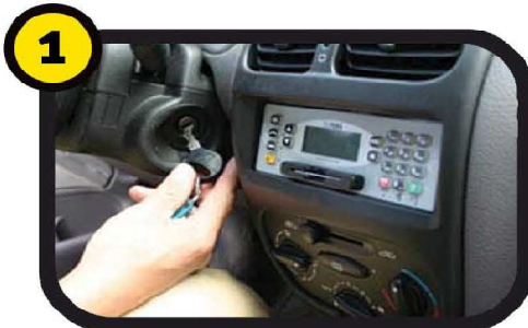
Neem een oude doek of ovenwant en start uw auto.

Controleer zelf op eenvoudige manier of de achterdemper van uw uitlaat aan vervanging toe is. Volg de fotoreeks en binnen een paar minuten weet u de staat van de achterdemper. Let op! Wanneer de motor warm is kan de uitlaat heet zijn en wanneer de motor koud is kan er, bij een eventueel lek, condens uit komen.