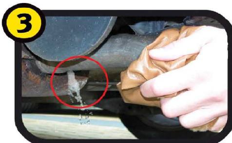
Komt er water of condens uit uw achterdemper of hoort u een sissend geluid? Dan is deze lek.