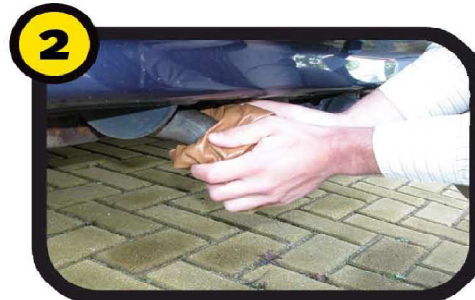
Houd de doek tegen het einde van de uitlaat. Als uw uitlaat 2 openingen heeft, dicht deze dan beide.