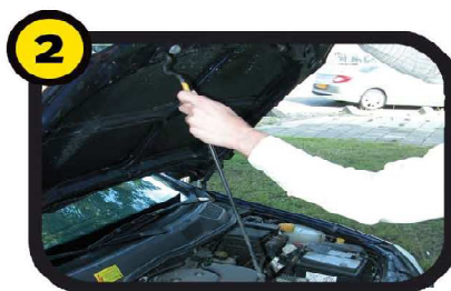
2 Zet de motorkap goed vast met de houder.