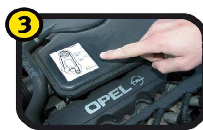
3 Kijk of u een sticker heeft op de motor met daarop de kilometerstand waarbij de distributieriem vervangen is. Deze kan ook aan de binnenkant van uw auto zitten.