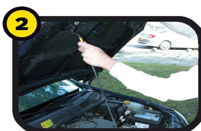
2 Zet de motorkap goed vast met de houder en zoek het oliereservoir.