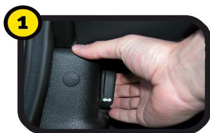
1 Open de motorkap. De hendel hiervan zit meestal links onder het stuur van uw auto. Zo niet, raadpleeg dan het boekje.

U kunt eenvoudig de staat van de motorolie controleren door in de dop van het oliereservoir te kijken. Volg de fotoreeks en u weet direct of de motorolie ververs moet worden. Let op! Wanneer de motor warm is kunnen de motoronderdelen heet zijn.